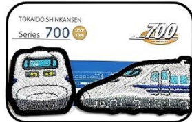
②東海道新幹線車両ワッペン 700系

正面：約よこ 33mm × たて 36.7mm 側面：約よこ 60mm × たて 30mm