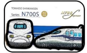
④東海道新幹線車両ワッペン N700S

正面：約よこ 33mm × たて 33.7mm 側面：約よこ 60mm × たて 30mm