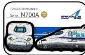
③東海道新幹線車両ワッペン N700A

正面：約よこ 33mm × たて 33mm 側面：約よこ 60mm × たて 29mm