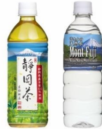
旅茶房 静岡茶(左) Mont Fuji(右)

2020年7月1日(水)～2020年7月14日(火)の期間に、 駅弁WEB予約サービスで、駅弁をご購入いただくと、 駅弁1個につき、「旅茶房 静岡茶 500ml(お茶)」または 「Mont Fuji 500ml(水)」を1本プレゼント。