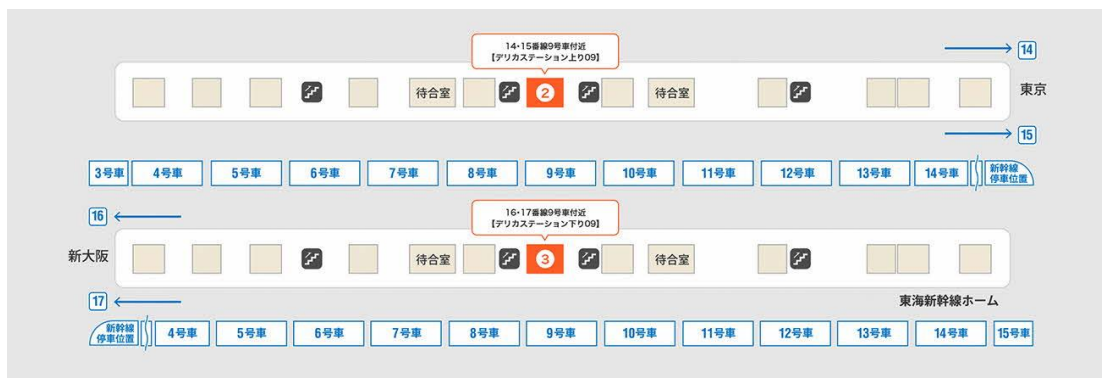
対象店舗（名古屋駅ホーム）