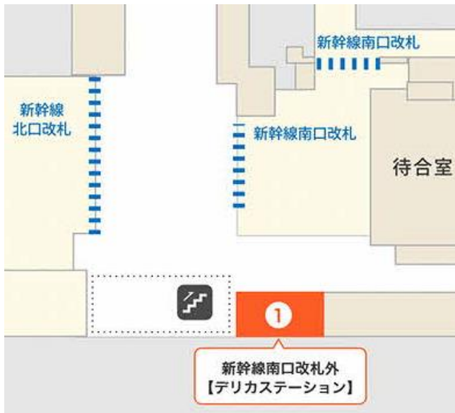
対象店舗（名古屋駅コンコース）