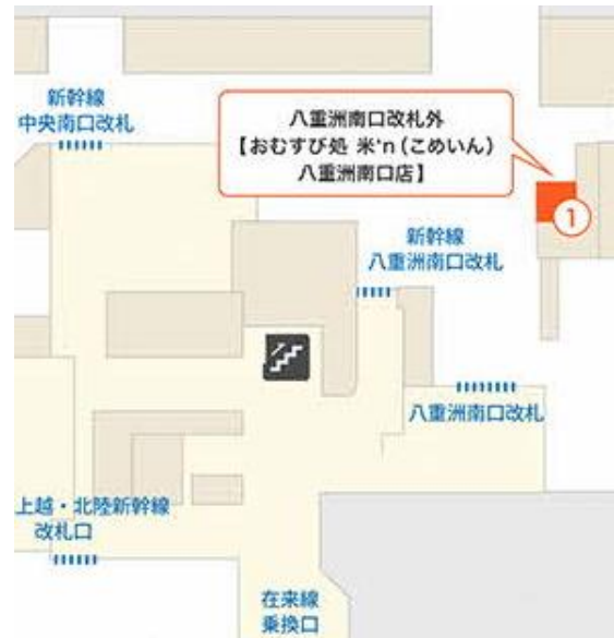
対象店舗（東京駅コンコース）