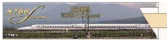
東海道新幹線 富士山弁當 イメージ